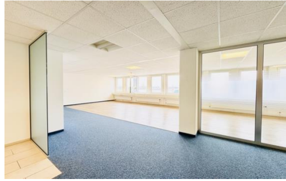
Eingangsbereich / Ausstellungsraum