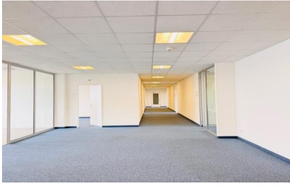
Eingangsbereich mit Korridor zu Einzelbüros