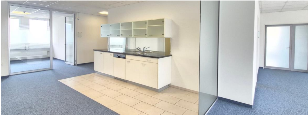
Teeküche und Zugang zu Einzelbüro