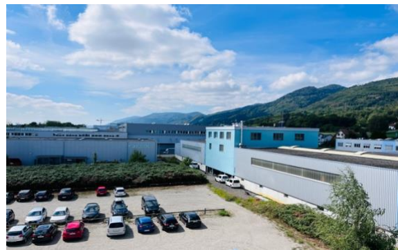
Aussicht aus dem 4. Obergeschoss

Für weitere Informationen besuchen Sie unsere Website www.businessparkwest.ch .