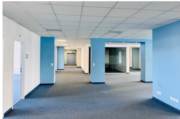
Grossraumbüro und Zugänge Einzelbüros