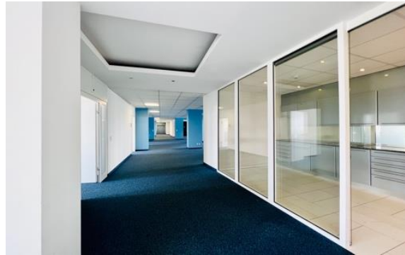
moderne und gut ausgestattete Küche