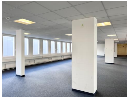
helle und offene Arbeitsfläche