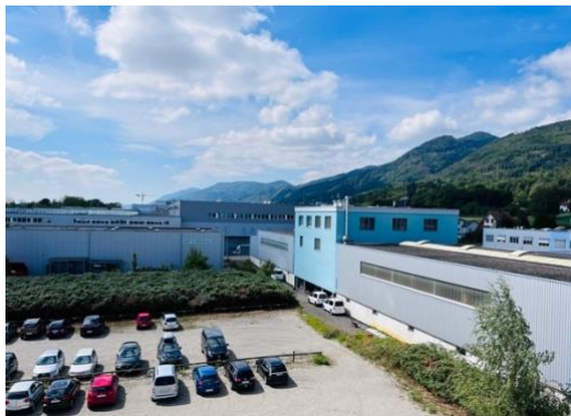
Aussicht und Aussenparkplätze