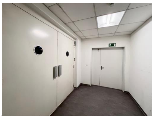
Warenlift direkt in die Fläche