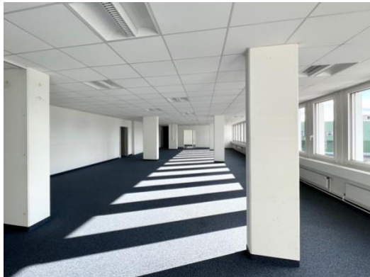
Grossraumbüro - hell, modern, offen