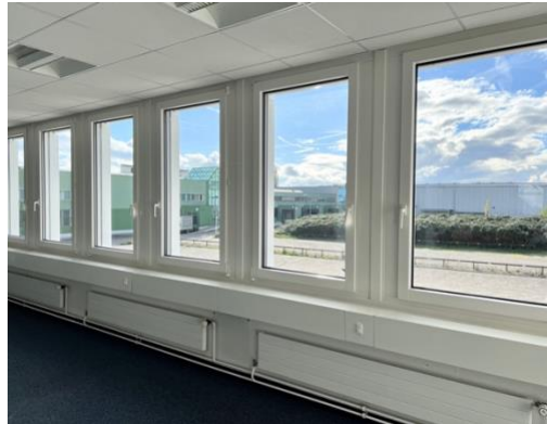
helle Büroflächen mit Aussicht