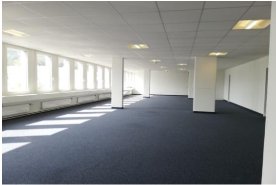
Grossraumbüro - hell, modern, offen