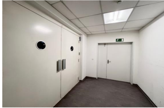
Warenlift direkt auf der Fläche