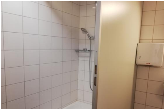
Dusche mit WC