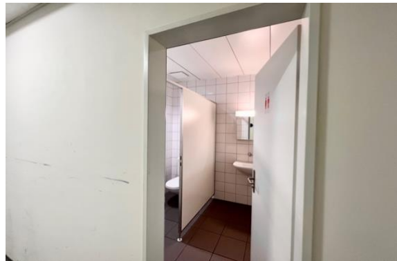
WC Anlage beim Empfang