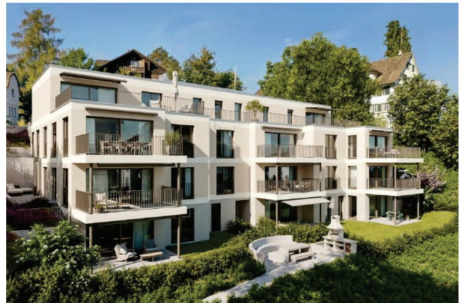
Aus der Verkaufsdokumentation

Wir kennen das Objekt und zeigen Ihnen gerne die entsprechenden Finanzierungsmöglichkeiten in einem persönlichen Gespräch. Sie müssen uns dazu keine Objektdokumente einreichen.