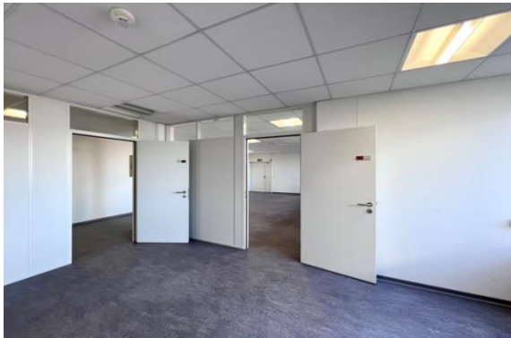
Einzelbüro mit Zugang Grossraumbüro