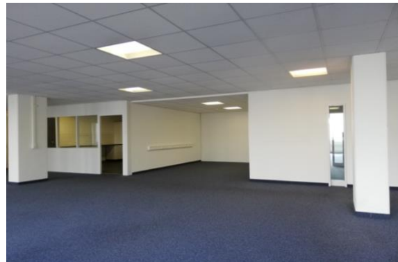
Grossraumbüro mit Zugang zur Teeküche