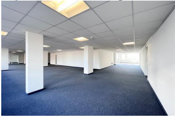
Grossraumbüro beim Empfang