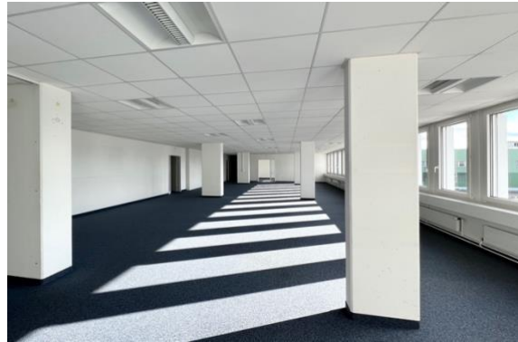
hell, modern, offen