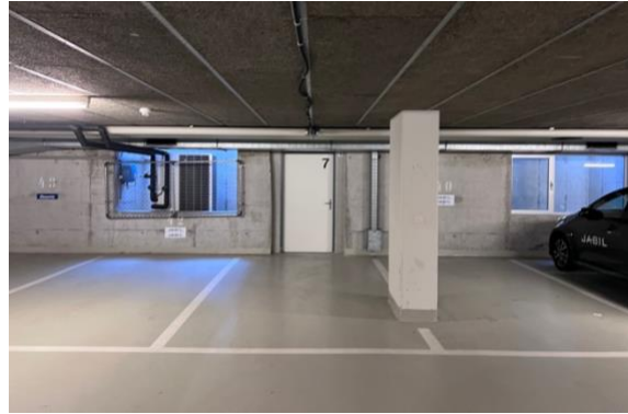
Einstellplätze in der Tiefgarage

Interesse geweckt? Vereinbaren Sie noch heute eine Besichtigung!