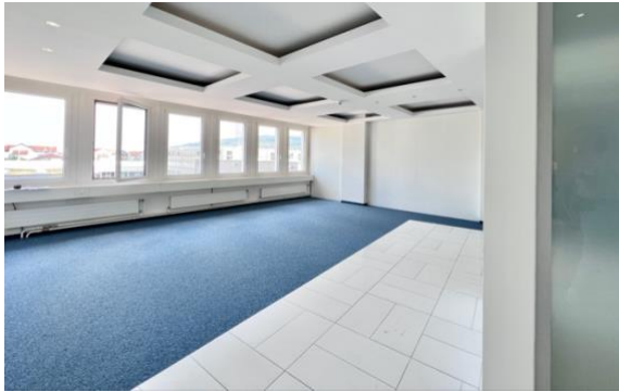
Eingangsbereich mit Gäste-Toilette