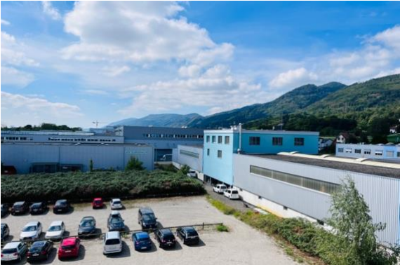
Aussicht und Aussenparkplätze