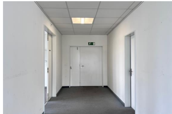
Eingangsbereich mit Toilette