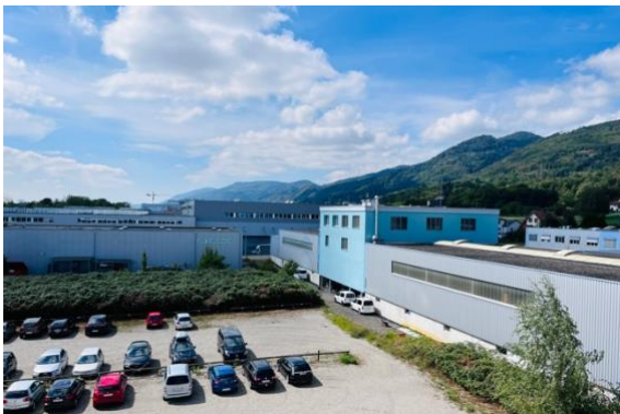
Weitsicht und Aussicht auf die Parkplätze