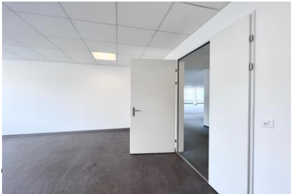
Einzelbüro mit Sicht ins Grossraumbüro