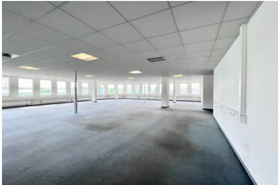
Grosse, helle Fläche