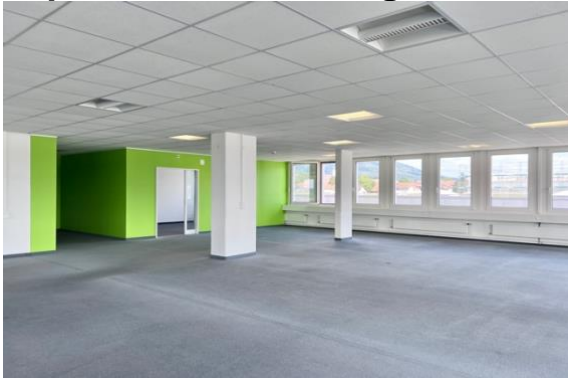
Grossraumbüro und Zugang Einzelbüro