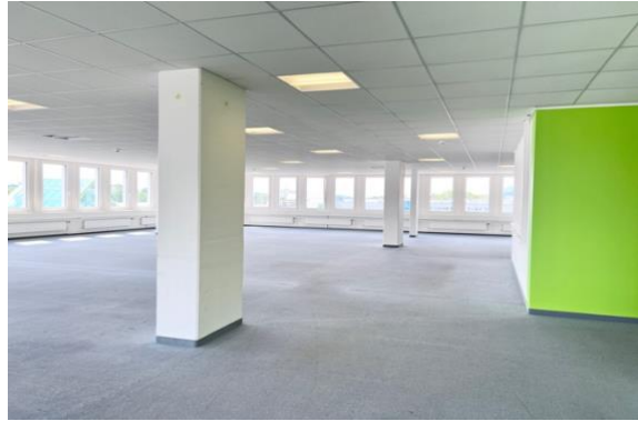
offene und moderne Fläche