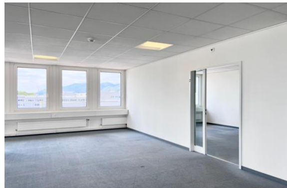
Grossraumbüro und Zugang Einzelbüro