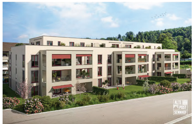
Aussenansicht, Tösstalstrasse 375, 8482 Sennhof (Winterthur)

Auf Wunsch vermitteln wir Ihnen auch gerne den Kontakt zu einem ZKB Berater in der Filiale Ihres Wohnorts.