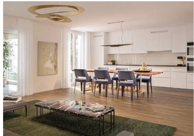
Innenansicht, Tösstalstrasse 375, 8482 Sennhof (Winterthur)