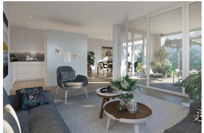
Matma Immobilien AG