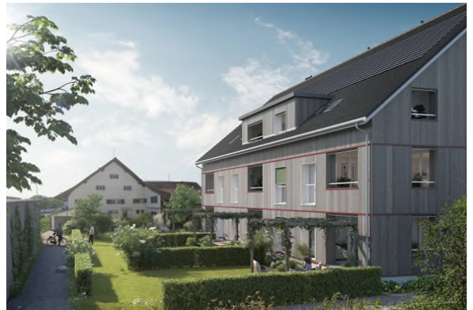
Matma Immobilien AG

Auf Wunsch vermitteln wir Ihnen auch gerne den Kontakt zu einem ZKB Berater in der Filiale Ihres Wohnorts.