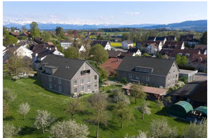
Matma Immobilien AG

Auf Wunsch vermitteln wir Ihnen auch gerne den Kontakt zu einem ZKB Berater in der Filiale Ihres Wohnorts.