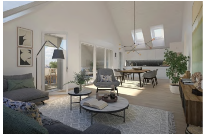
Matma Immobilien AG