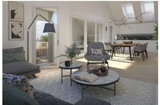
Matma Immobilien AG