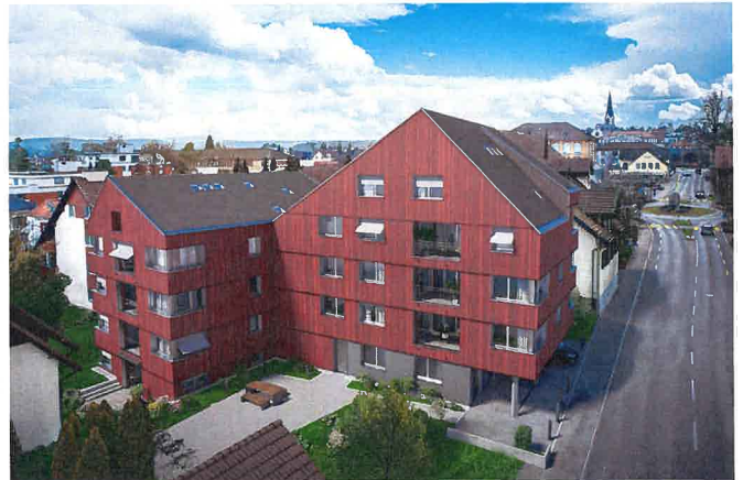
Wohnung Nr. 7 inklusive Parkplatz