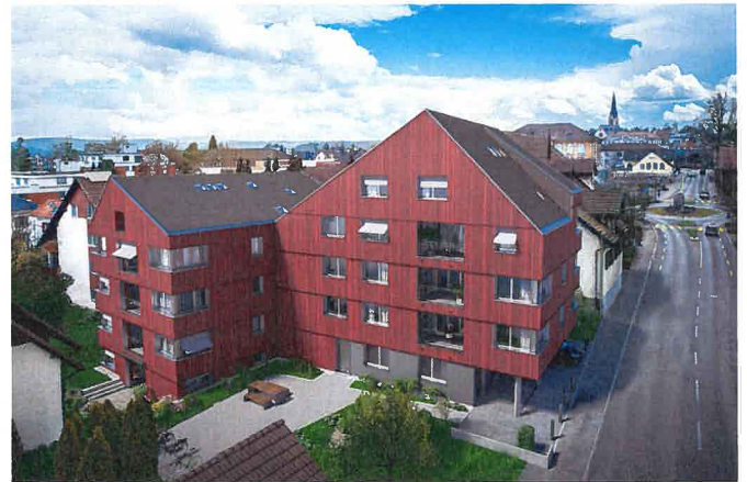
Wohnung Nr. 4 inklusive Parkplatz