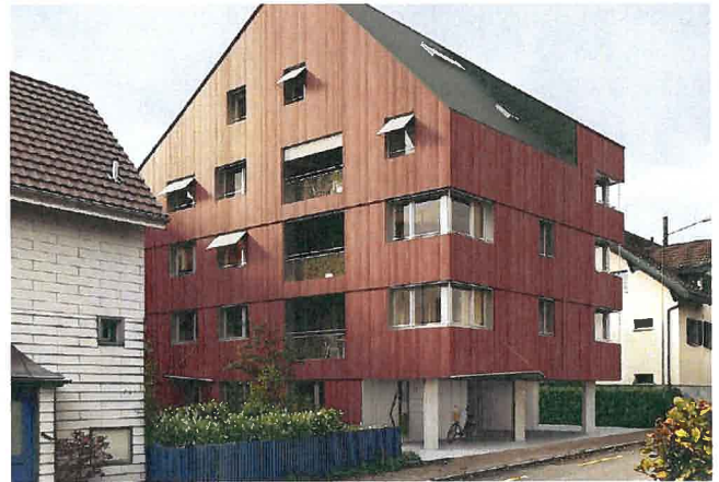
Wohnung Nr. 5 inklusive Parkplatz