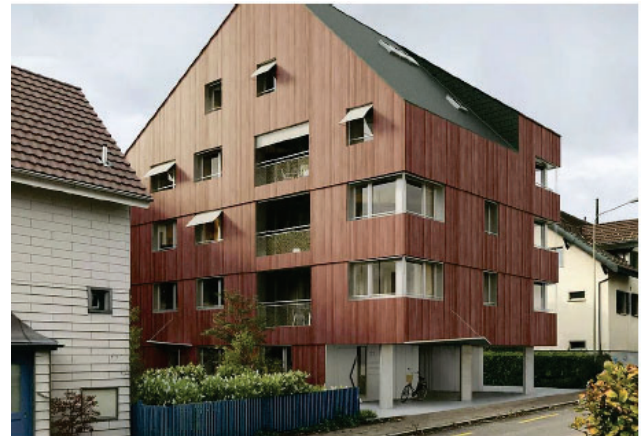
Wohnungen inklusive Parkplatz