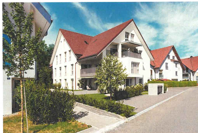
Wohnung Nr. A6, 3.5-Zimmerwohnung mit zwei Tiefgaragenplätze