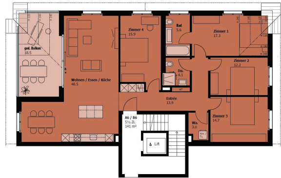
Wohnungen A6 / B6