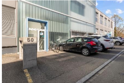
Kunden PP + Eingang