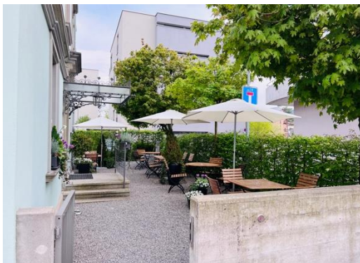
Erlesenes der Laden/ das Bistro