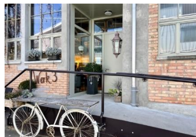
Werk 3 Café und Bäckerei vis à vis