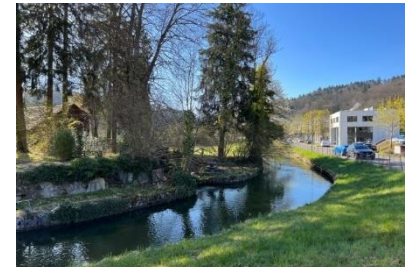
Naherholungszone an der Murg