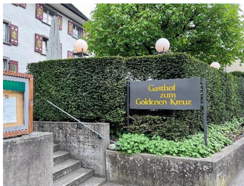
Gasthof zum Goldenen Kreuz