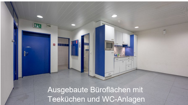
Ausgebaute Büroflächen mit Teeküchen und WC-Anlagen