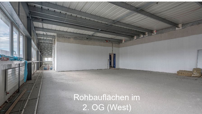
Rohbauflächen im 2. OG (West)