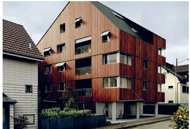
Wohnung inklusive Parkplatz