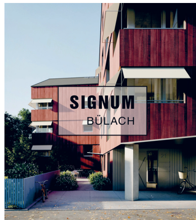
Wohnung Nr. 5, 3 1/2 Zimmerwohnung mit einem Tiefgaragenparkplatz

Auf Wunsch vermitteln wir Ihnen auch gerne den Kontakt zu einem ZKB Berater in der Filiale Ihres Wohnorts.