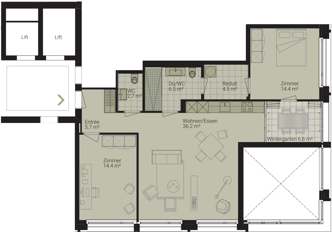
Aussicht Richtung Münchensteinerstrasse