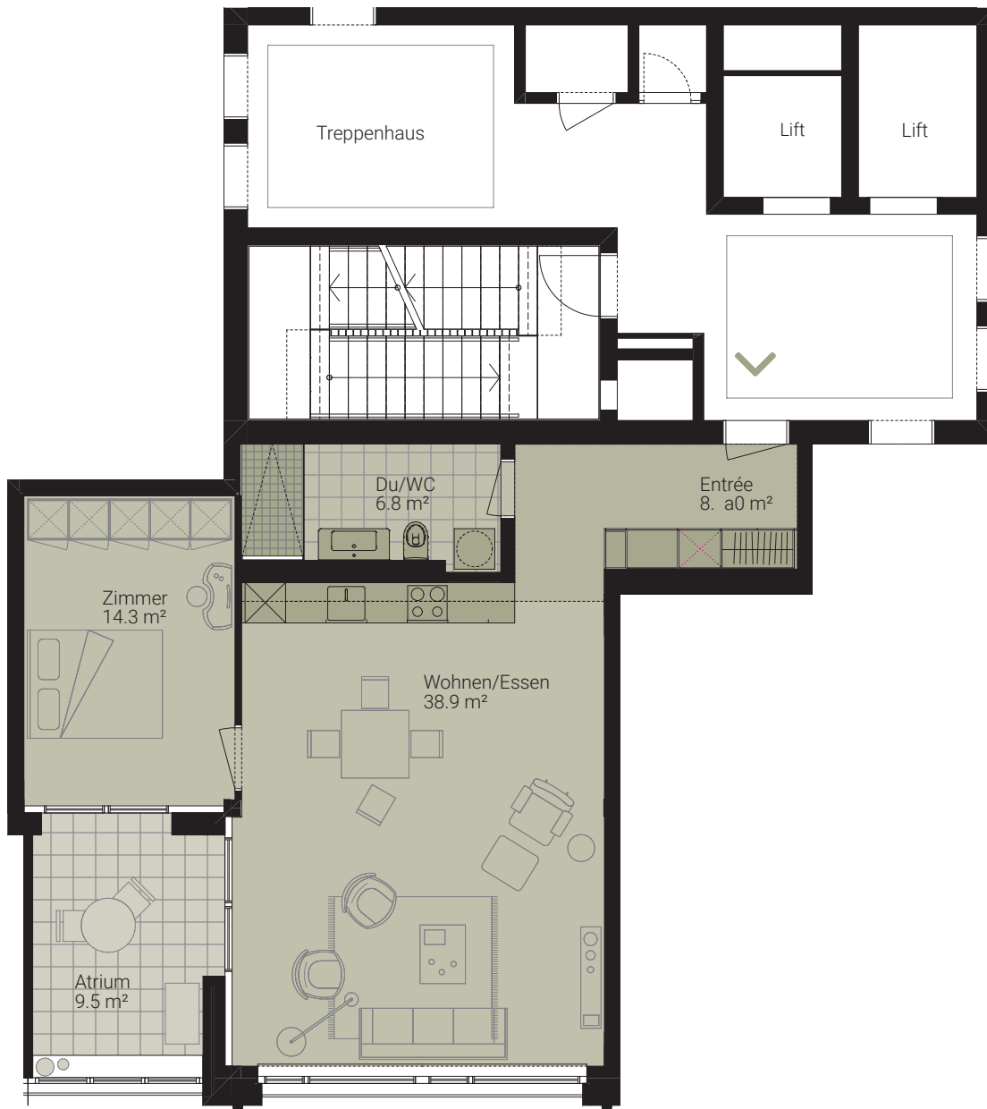
Aussicht Richtung Münchensteinerstrasse