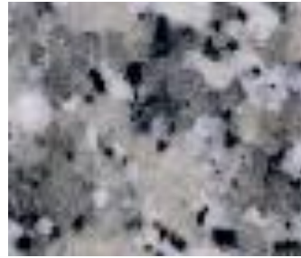
Naturstein, Granit Bianco Sardo