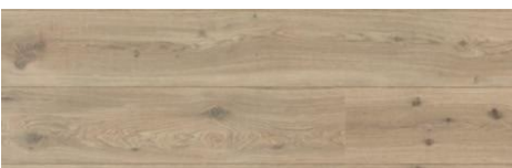
Klötzliparkett versiegelt, oder Linoleum