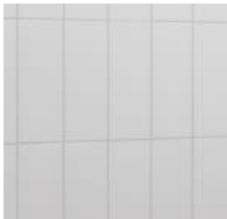
Keramikplatten, matt weiss