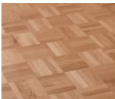
Klötzliparkett versiegelt, oder Linoleum