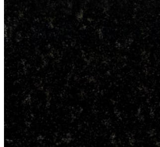
Naturstein, Granit Nero Pretoria