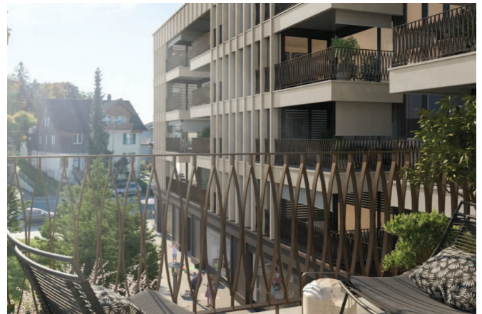
Attraktives Wohnen an top Lage; der Rütlihof