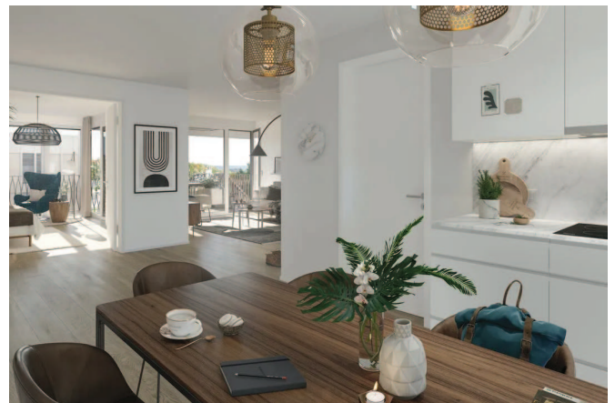
Der offene Essbereich ist frei von Schranken, Quelle: www.ruetlihof.ch

Wir kennen das attraktive Neubauprojekt gut und zeigen Ihnen gerne die entsprechenden Finanzierungsmöglichkeiten in einem persönlichen Gespräch. Sie müssen uns dazu keine Objektdokumente einreichen.