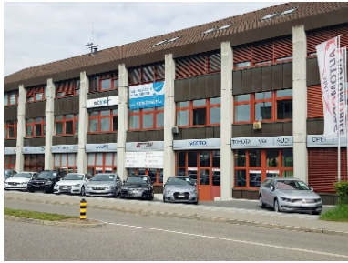
Gebäude von der Dorfstrasse