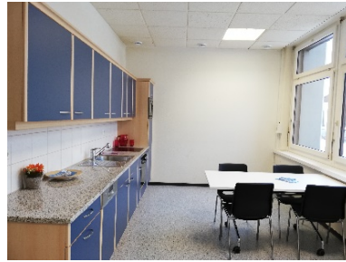
Aufenthaltsraum / Küche