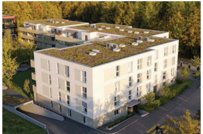
Solipark in Bülach

Wir kennen das Objekt und zeigen Ihnen gerne die entsprechenden Finanzierungsmöglichkeiten in einem persönlichen Gespräch. Sie müssen uns dazu keine Objektdokumente einreichen.