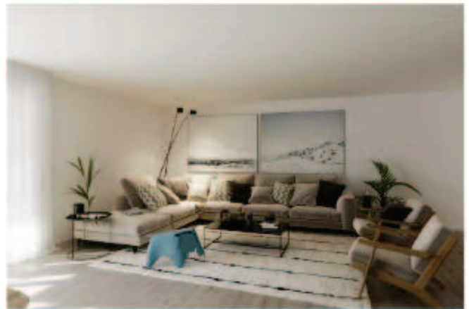
3.5-Zimmer-Wohnung im Solipark A3.1 (inkl. überbreiteter Tiefgaragenplatz)