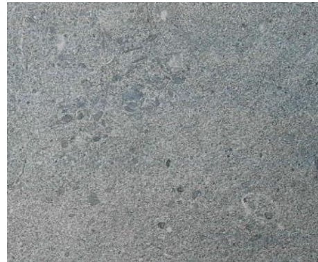
Feinsteinzeug, dunkel grau