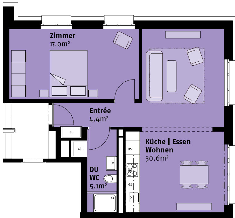
Wohnung 03.100 2.5 Zi-Whg. BF 56.7m 2