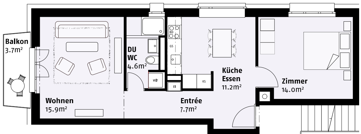
Wohnung 04.200 2.5 Zi-Whg. BF 53.4m 2