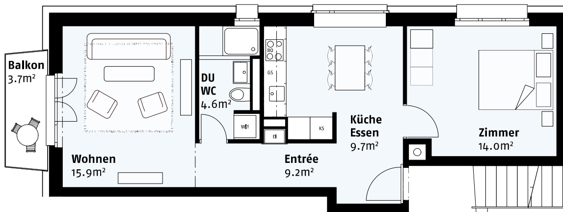
Wohnung 02.200 2.5 Zi-Whg. BF 53.4m 2