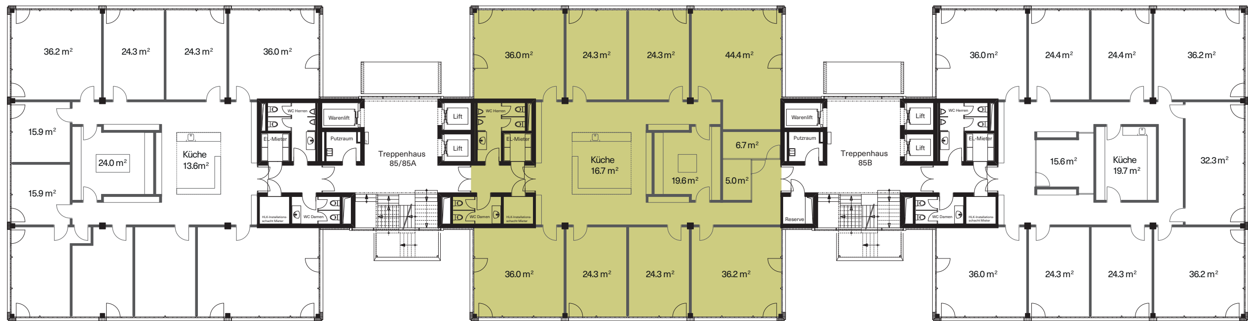
Turm 85-3 415.0 m 2