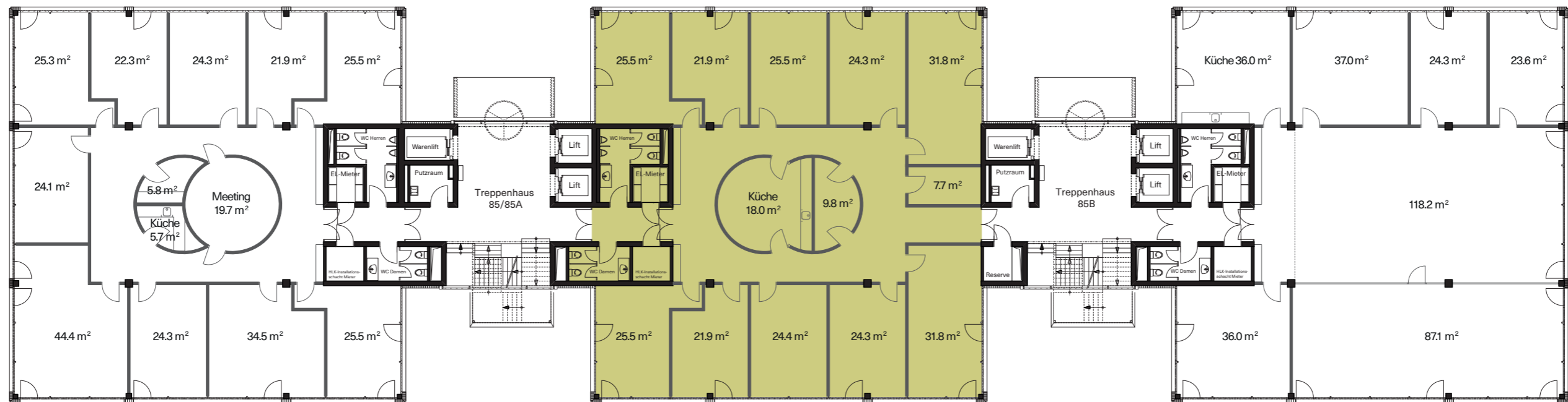
Turm 85-2 415.0 m 2