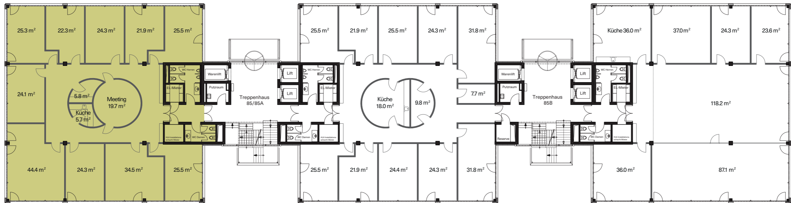
Turm 85-2 415.0 m 2