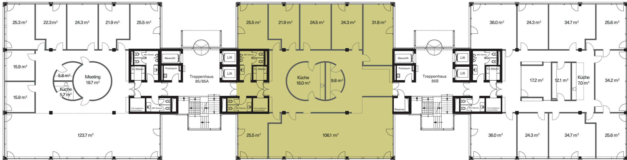
Turm 85-1 415.0 m 2