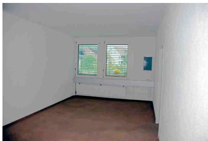
Raum 1 mit Balkonzugang