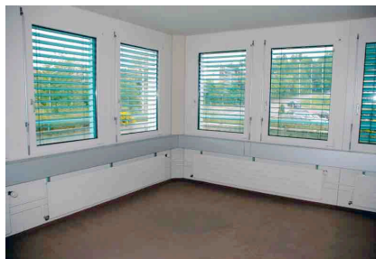
Raum 2 (Eckzimmer)