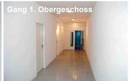
Gang 1. Obergeschoss