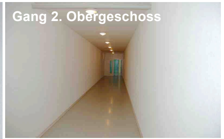
Gang 2. Obergeschoss