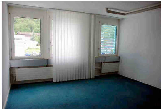
Raumansicht 1 (Fenster)