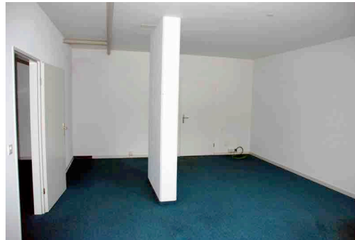
Raumansicht 2 (Eingang)