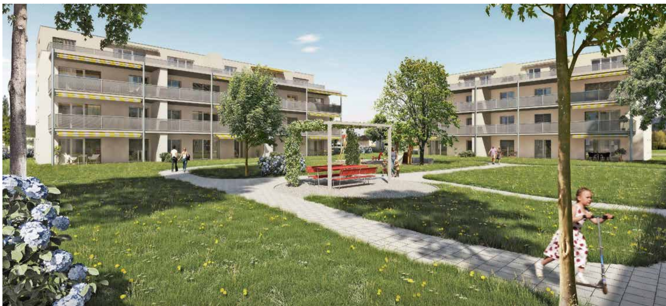
Zentral gelegenes Grün: Die Mehrfamilienhäuser der Wohnsiedlung Solidus umschliessen grosszügige, reich bepflanzte Grünzonen, die zum Verweilen und Spielen einladen.

4 Stil und Ambiente: Im Solidus-Haus 4 ist sogar die Treppe mit Teppich ausgelegt.