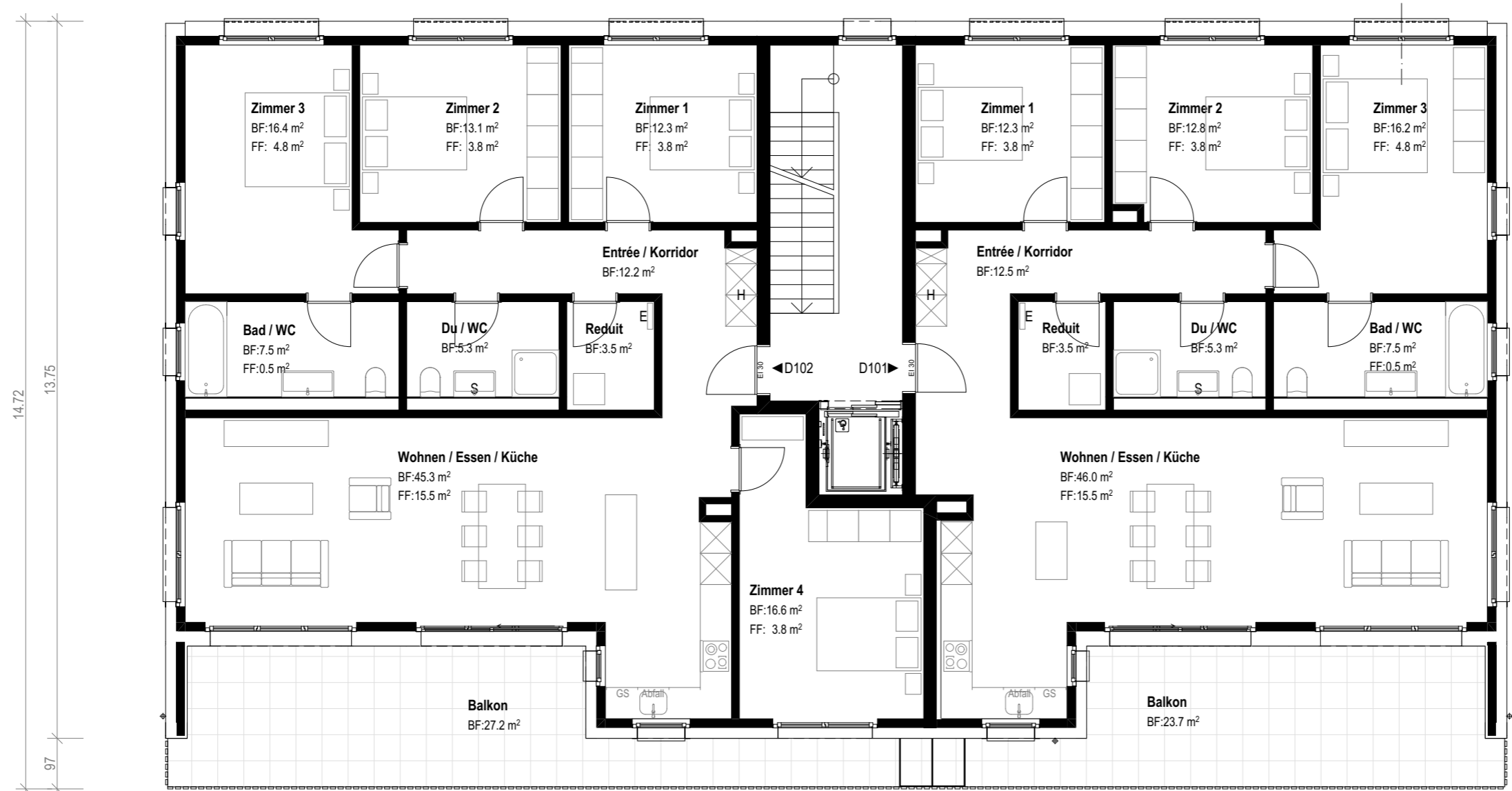
5 1/2 Zi.-Wohnung BWF:137.8 m 2