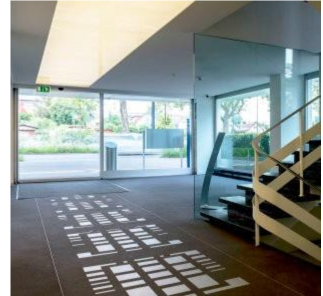
Entrée T60 mit Kunst am Bau

Im Gewerbehause T60 vermieten wir Gewerberäumlichkeiten, die Sie individuell nach Ihren Wünschen und Bedürfnissen ausbauen können.