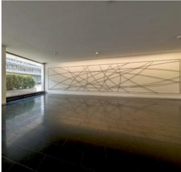
Repräsentatives Entrée L45