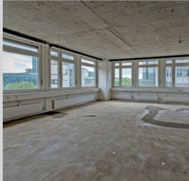
Ihr neues Domizil mit Blick über Oerlikon?