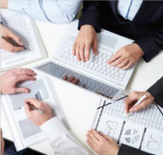
Besprechen wir uns! Wir freuen uns auf Sie.