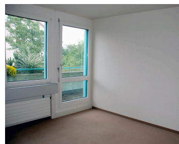
Büro mit Balkonausgang