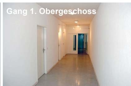
Gang 1. Obergeschoss