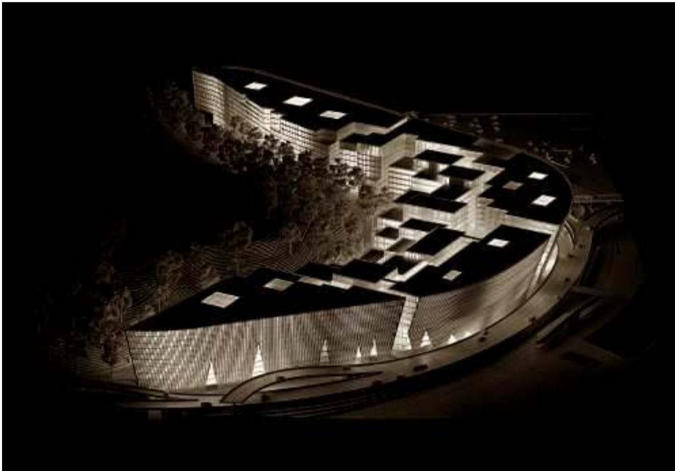
Grossartig oder überdimensioniert? Das Neubauprojekt The Circle am Flughafen Kloten.